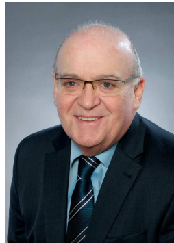
Harald Bosch Außenhandel